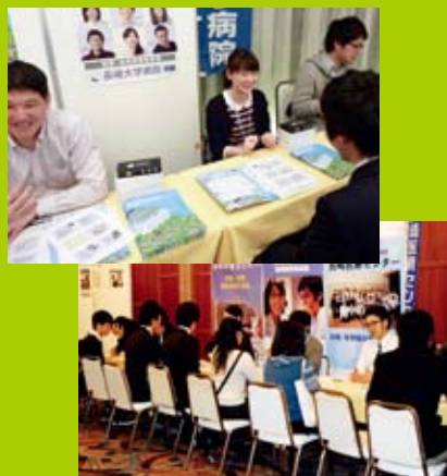
新・鳴滝塾が主催した長崎県17病院合同説明会のようす。県内外での広報活動も積極的に行っています。

長崎県では、県内全ての臨床研修病院と長崎大学病院の計17病院が協力して研修医の育成にあたっています。その主幹をしているのが新・鳴滝塾。医学生の病院見学時のフォローから研修医の教育まで、連続的な医師育成の体制を敷いています。県内の研修医同士交流できるような機会も設けられ、切磋琢磨できる環境を新・鳴滝塾が用意して皆さんを待っています！少しでも気になったら見学へ行ってみましょう。新・鳴滝塾では一度に複数の病院をみたい場合の見学ルートや日程、見学内容の相談ができます。遠方から見学に行く場合、費用が気になるのですが、これも新・鳴滝塾がカバー。申請を行えば旅費のサポートが受けられます。